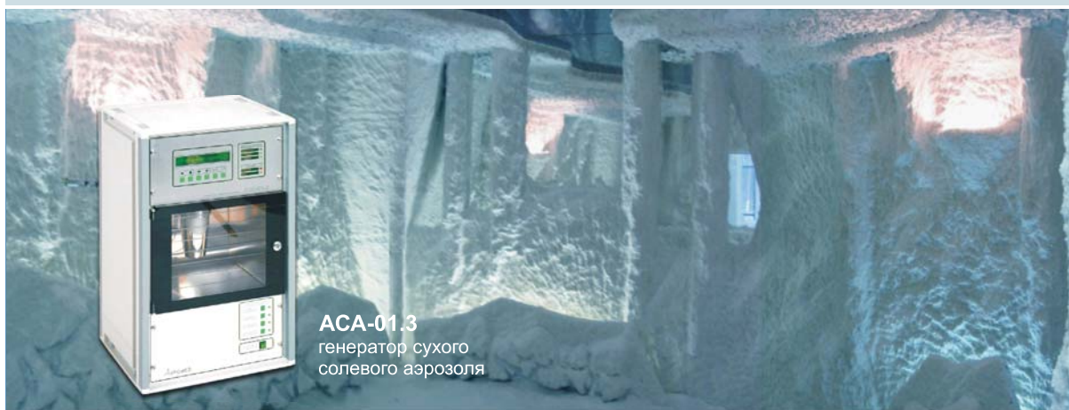
ACA-01.3 генератор сухого солевого аэрозоля

УПРАВЛЯЕМЫЕ ГАЛОКОМПЛЕКСЫ • НЕБУЛАЙЗЕРНЫЕ ИНГАЛЯТОРЫ • ГАЛОКАБИНЕТЫ • АЭРОИОНИЗАТОРЫ